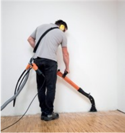
Der Motor des Schleifers wird getrennt vom Arbeitsgerät am Gürtel getragen.